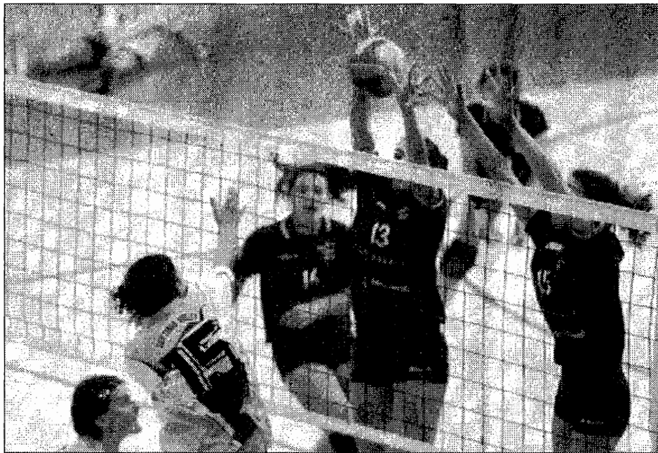
a finale femminile

suo pubblico: «E' stato il settimo uomo in campo» «Noi i più forti»