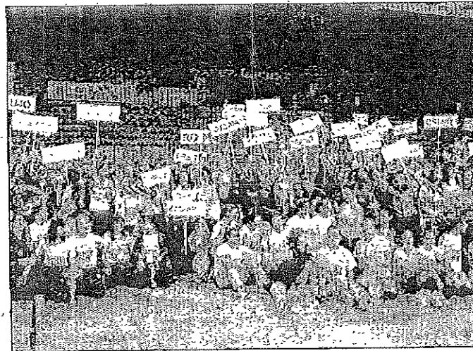
Un momento della festa finale di "Easter volley"