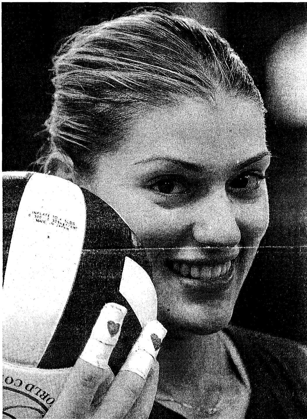
TOSCANA La campionessa Francesca Piccinini, nata a Massa 28 anni fa. A sinistra, un torneo internazionale

Weekend di pallavolo al DatchForum Con le Finali di Coppa Italia tanti campioni, partite e giochi per tutti